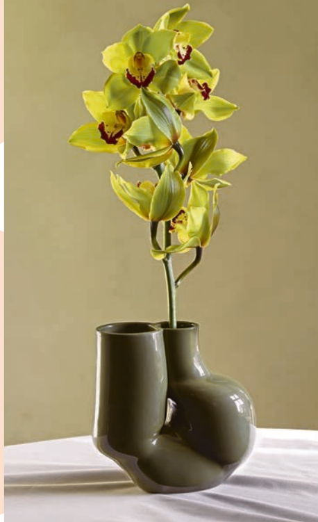
Vase „W&S Chubby“, ca. 75 €, Hay

Strenge geometrische Linien waren gestern – jetzt bekommen die cleanen Looks Konkurrenz von Kurven und Rundungen in allen Varianten. Neben Sofas, Tischen und Stühlen geben sich nun auch Accessoires wie Teppiche, Vasen, Leuchten und Skulpturen sanft und abgerundet. Von kreisrund über ellipsenförmig bis hin zu unregelmäßigen Wölbungen ist alles dabei. Runde Formen wirken im Gegensatz zu Ecken und Kanten weich und strahlen Gemütlichkeit aus. Sie symbolisieren Geborgenheit, steigern den Wohlfühlfaktor und bringen dadurch Harmonie in einen Raum. Auch nach Feng-Shui-Prinzipien sind organische, geschwungene Formen klaren Linien vorzuziehen, da an ihnen die Lebensenergie harmonisch entlangfließt. Keine Angst: Sie müssen nun nicht Ihre komplette Einrichtung umkrempeln, um in Harmonie wohnen zu können. Schon vereinzelte runde Formen, zum Beispiel in Form von einigen Accessoires, lockern die Atmosphäre eines Raumes auf und machen ihn gemütlicher.